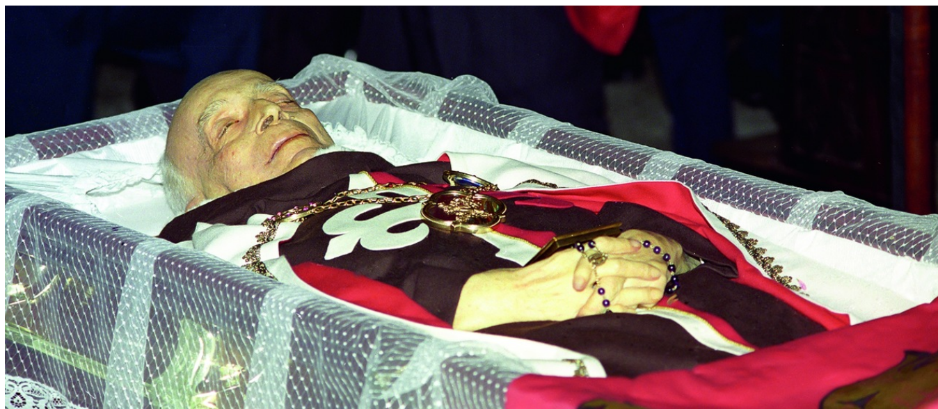
Missa de corpo presente na Igreja de Nossa Senhora da Consolação, 4/10/1995

Ao abandonar o corpo sua alma foi acolhida por Deus, e todas as dúvidas e incertezas se dissiparam. Ele viu com clareza o quanto seu oferecimento havia sido bem recebido e produziria resultado: sua missão seria cumprida, e a Revolução, derrotada.