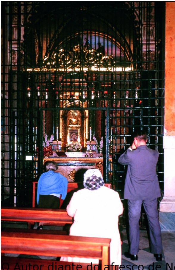
O Autor diante do afresco de Nossa Senhora do Bom Conselho, em agosto de 1995